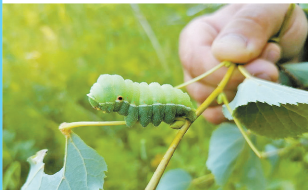
«Диногусеница (похожа на малыша динозавра)» Кирилук Олеся Павловна, с. Сладковское