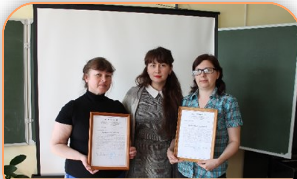
Вручение именных сертификатов кандидатам в родители

сын или дочка могут долгое время не привязываться к приёмной семье, как ребёнок переживает потерю кровной семьи. Рассматриваются вопросы задержек в психическом, интеллектуальном развитии, которые могут возникнуть у детей в результате переживаний и стрессов, обсуждаются способы коррекции таких задержек.