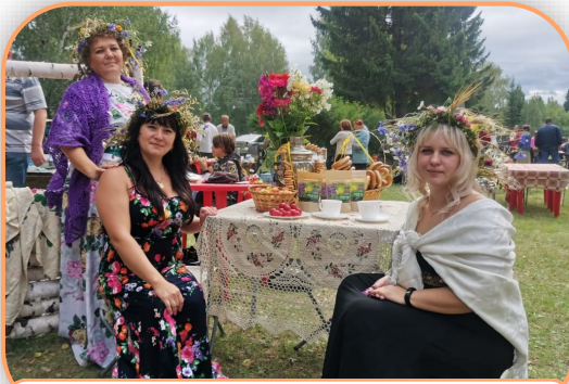
Специалисты стационарного отделения социальной реабилитации на фестивале «Самоцветная сторона»

становился лауреатом престижной Национальной премии в области событийного туризма «Russian EventAwards».