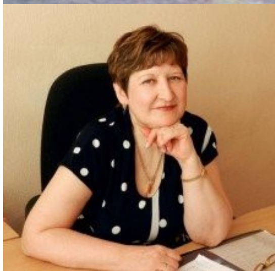
Директор ГАУ «КЦСОН города Каменска-Уральского»