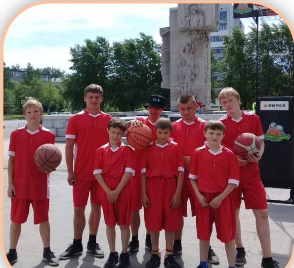
Спортивная команда воспитанников учреждения

В жаркий майский день на площади Дворца Молодёжи города Нижний Тагил проходил XIII фестиваль по стритболу среди воспитанников детских социально-реабилитационных центров.