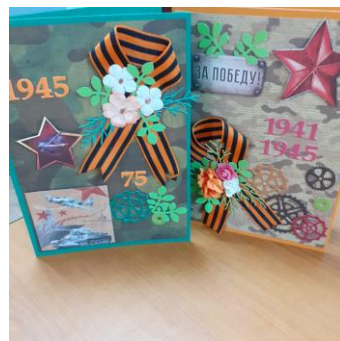
Замечательные открытки вручены ветеранам Великой Отечественной войны

Для участия в онлайн-акции «Георгиевская лента», «Окна Победы» и «Свеча памяти» специалисты участковой социальной службы привлекли жителей города, поселков Билимбай, Битимка, Новоуткинск и Крылосово, села Новоалексеевское, деревень Коновалово и Вересовка. Жители населенных пунктов нашего городского округа, оказались настоящими патриотами своей малой Родины. Они активно участвовали в акциях и делились друг с другом рассказами о своих родственниках, воевавших в года Великой Отечественной войны.