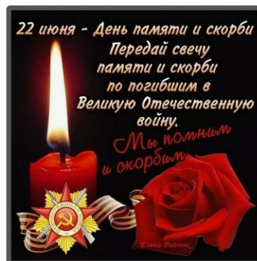
Онлайн-акция «Свеча памяти»