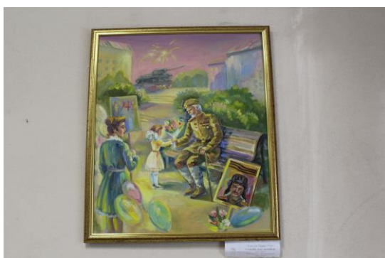
Картина «Спасибо деду за победу!» Работа учеников Первоуральской детской художественной школы