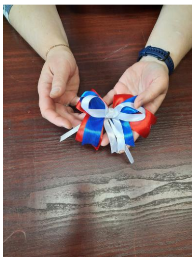
Прекрасный результат мастер-класса «Российский триколор»

Обмен впечатлениями с участниками акций и мероприятий осуществлялся через онлайн-общение и показал, что для людей очень важно осознание того, что они живут в великой стране Россия.