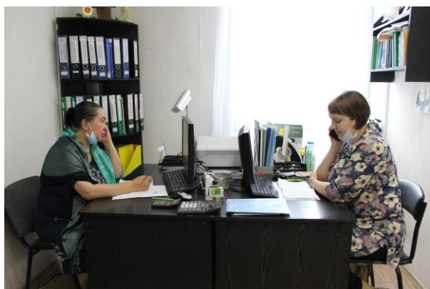
Специалисты участковой социальной службы проводят акцию «Сидим дома 65+»

Использование онлайн - сервисов повышает качество жизни пенсионеров на самоизоляции. Прежде всего, нужно настроить пожилого человека на позитив и не давать ни единой возможности для уныния и бездействия. В настоящее время это стало одним из приоритетных направлений в работе специалистов участковой социальной службы.