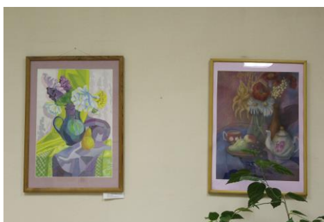
Экспонаты выставки «Осеннее очарование». Работы учеников художественной школы.

В конце прошлого года и в наступившем году были организованы несколько выставок талантливых молодых первоуральцев.