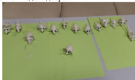
Замечательные мышки получились!

Работы, сделанные в рамках проекта «Мастерская чудес», будут показаны горожанам на выставке, приуроченной к Весенней неделе добра.