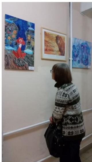
С большим интересом первоуральцы побывали на выставке работ учеников школы искусств «В мире животных».