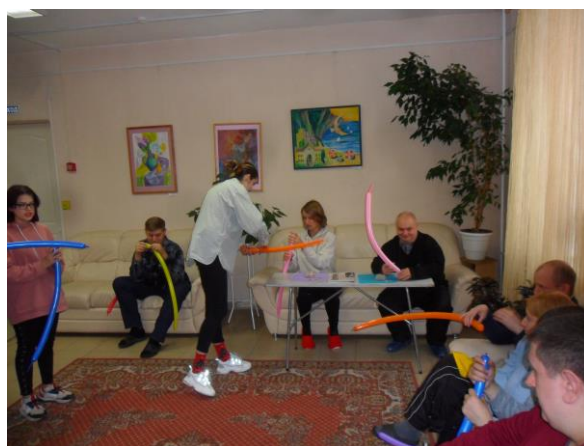
Все с интересом моделируют игрушки из воздушных шаров.