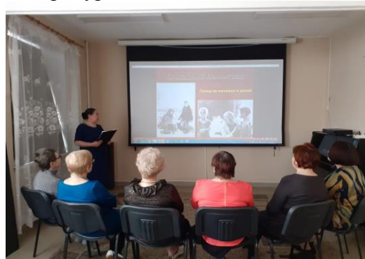
Показ слайд - фильма «Блокадный Ленинград»

Всероссийская акция памяти «Блокадный хлеб» проведена специалистами участковой социальной службы на территории городского округа Первоуральск