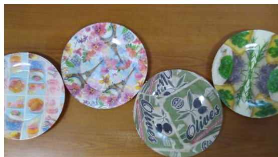
Красивые тарелки выполнены в технике «Декупаж»