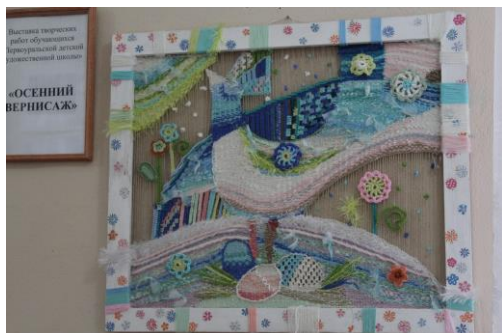
Выставка работ детей, обучающихся в Первоуральской художественной школе «Осенний вернисаж»