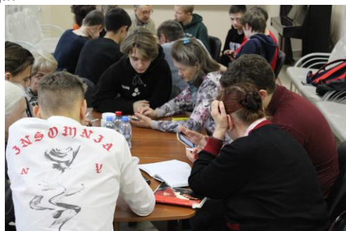
Студенты Первоуральского металлургического колледжа учат первоуральцев работать со смартфонами

В рамках работы отделения «Компьютерная грамотность» Школы пожилого возраста специалисты участковой социальной службы ввели новое направление «Обучение работе на гаджетах», которое пользуется огромной популярностью среди пожилых жителей города.