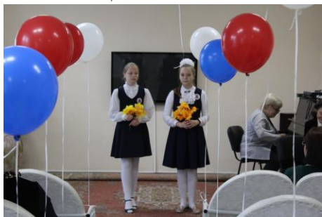
Ученики МБОУ СОШ №6 поздравляют первоуральцев с Днем пожилого человека.

К Дню пожилого человека специалисты участковой социальной службы провели мероприятия и акции.