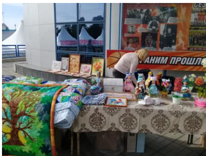
Работы первоуральских рукодельниц на выставке.

Работы первоуральчек понравились уральцам!