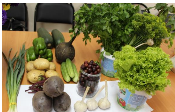
Вот такой разнообразный урожай выращивают садоводы общества слепых.

После мероприятия все разошлись в приподнятом настроении и готовые к новой битве за урожай 2020 года.