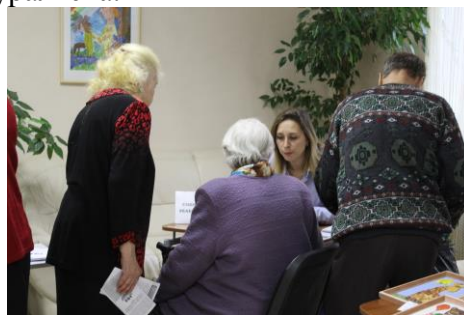
Первоуральцы на Дне открытых дверей нашего Центра активно интересовались условиями прохождения реабилитации в социально - реабилитационном отделении.

Они также активно участвуют в акциях «Из добрых рук - в добрые руки», приносят одежду и обувь для малообеспеченных граждан Первоуральска.