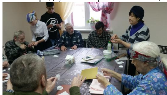
Мастер-класс проводят воспитанники социально-реабилитационного Центра для несовершеннолетних.

Участковая социальная служба нашего Центра активно сотрудничает с приютом. Специалисты проводят для его обитателей концерты, мастер-классы с участием школ и библиотек города, а также различные акции.