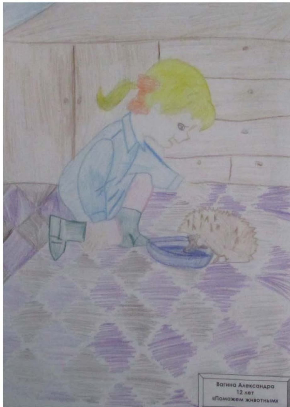
Вагина Александра 12 лет «Поможем животным»