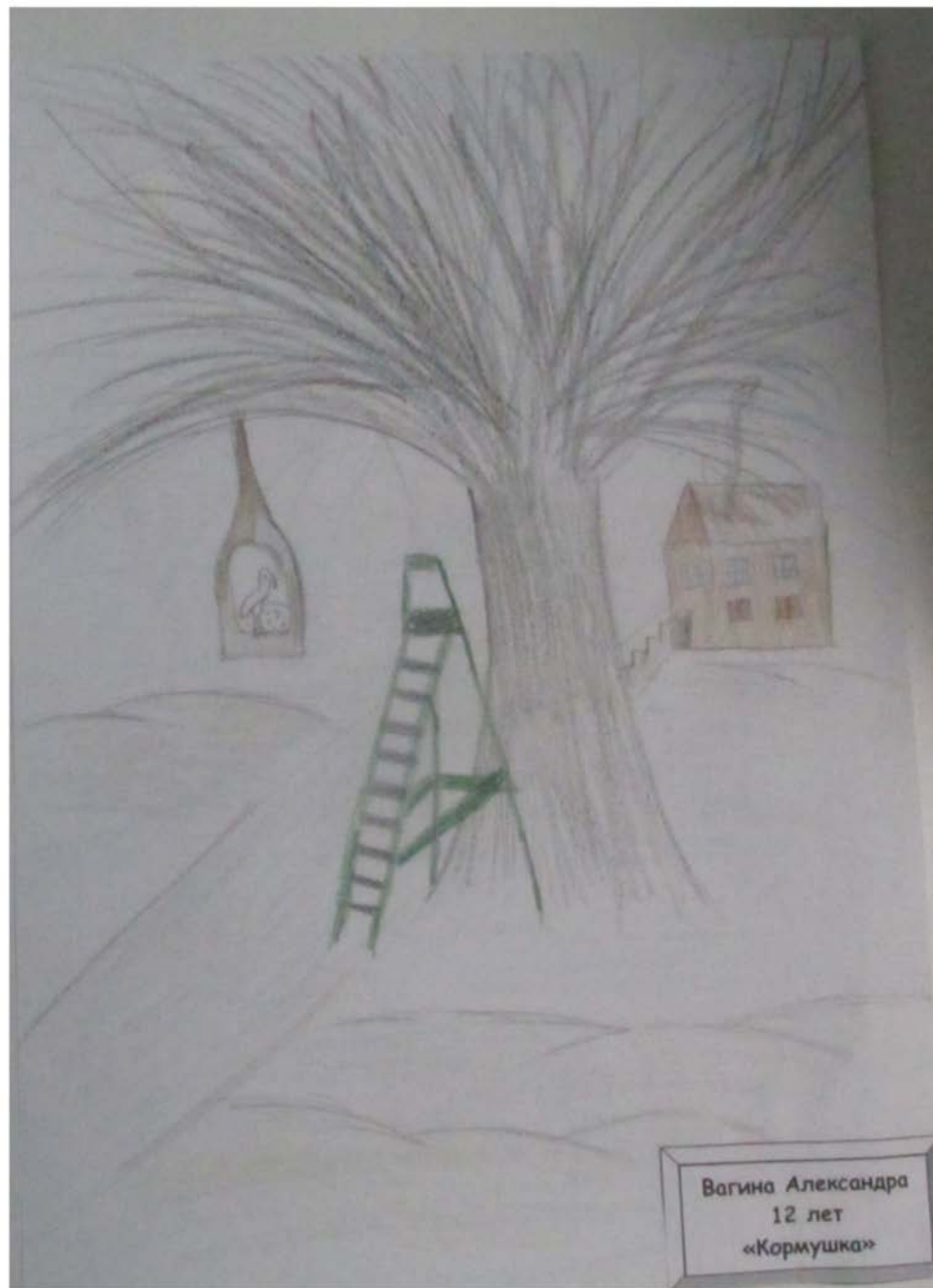
Вагина Александра 12 лет «Кормушка»