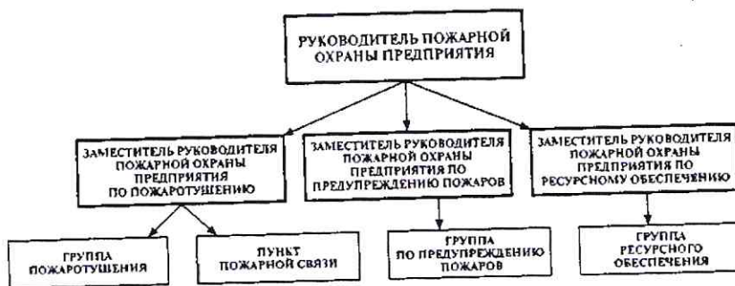
Рис. 3. Примерная организационная структура пожарной охраны предприятия

«Пожарная охрана предприятий. Общие требования» (рис. 3). Данными нормами установлены общие требования к пожарной охране предприятий, учреждений, организаций, фермерских хозяйств и иных юридических лиц независимо от их организационно-правовых форм и форм собственности