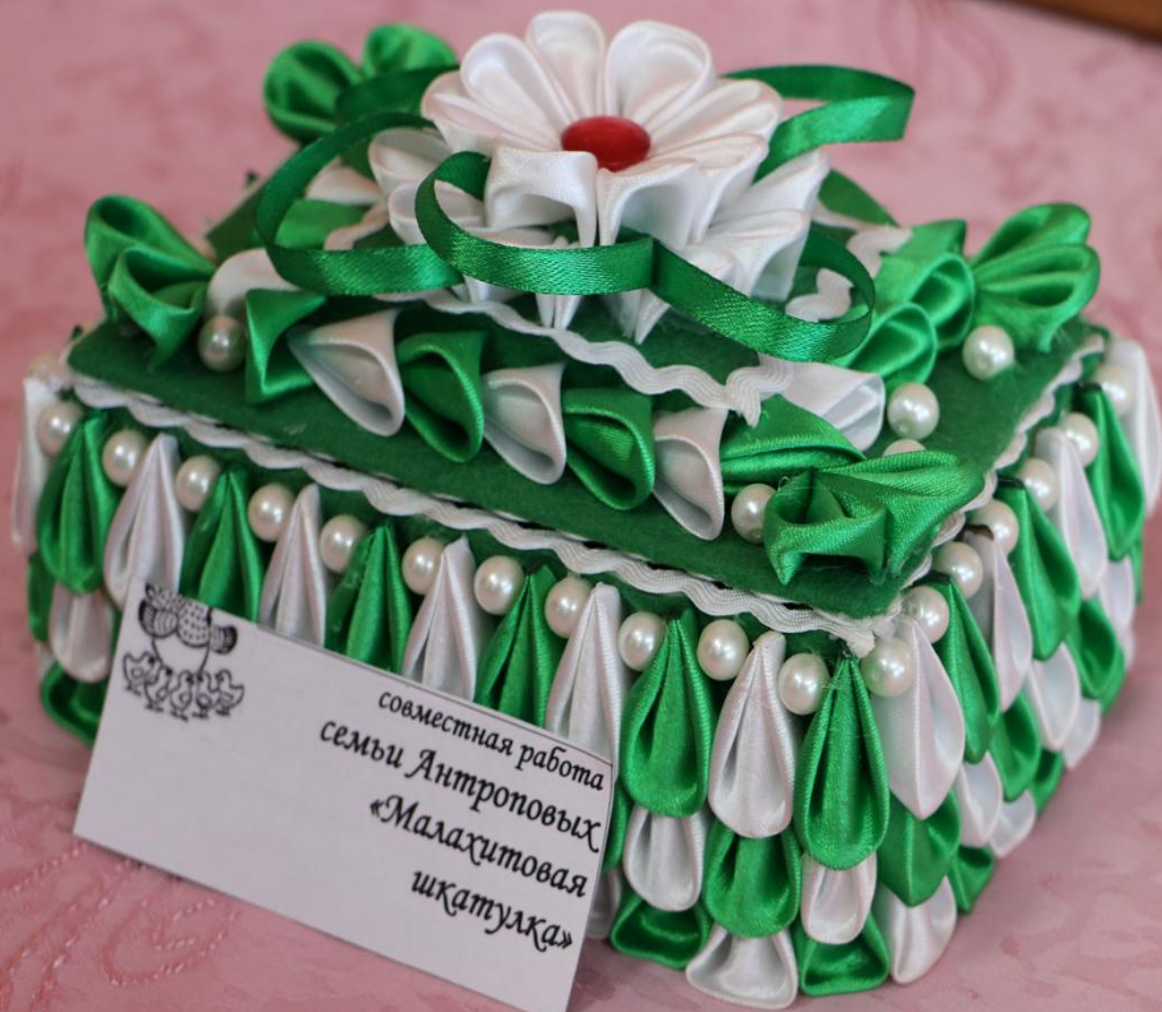
Выставка декоративно-прикладного творчества