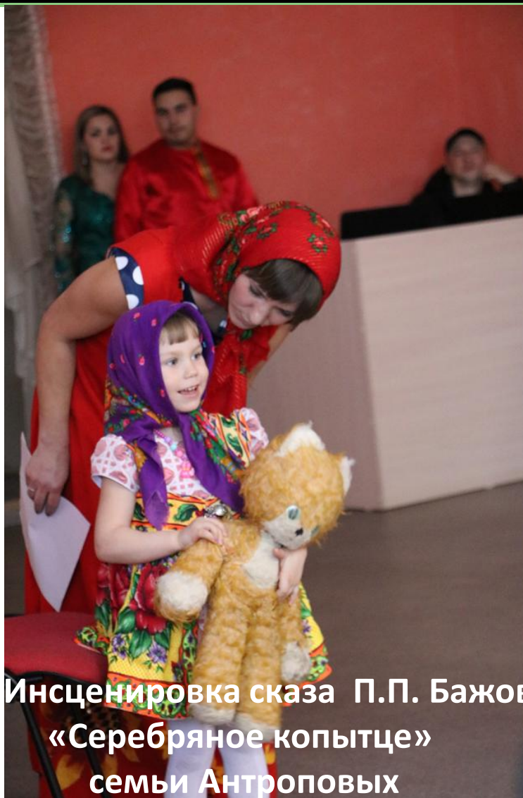
Инсценировка сказа П.П. Бажов «Серебряное копытце» семьи Антроповых