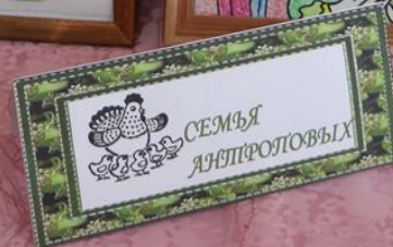
Выставка декоративно-прикладного творчества