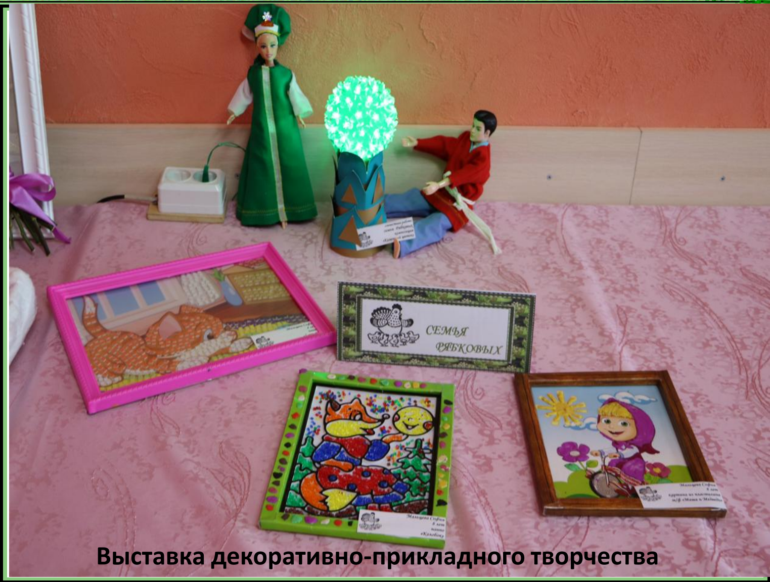
Выставка декоративно-прикладного творчества