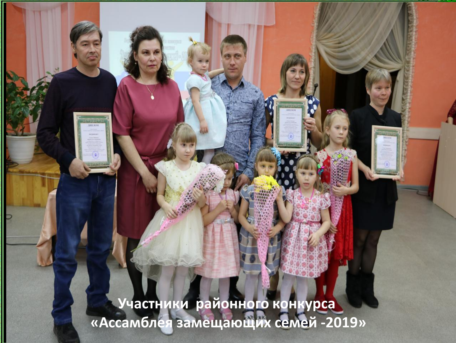
Участники районного конкурса «Ассамблея замещающих семей -2019»