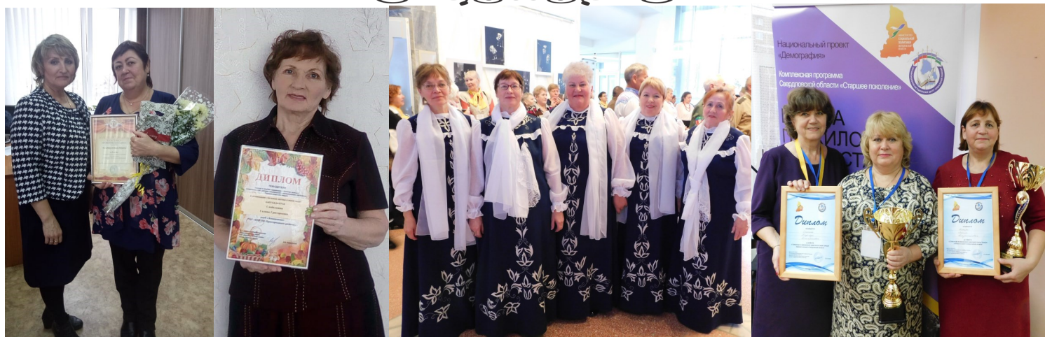
Фотогалерея слушателей Школы пожилого возраста Центра — победителей окружных и областных конкурсов, фестивалей и олимпиад