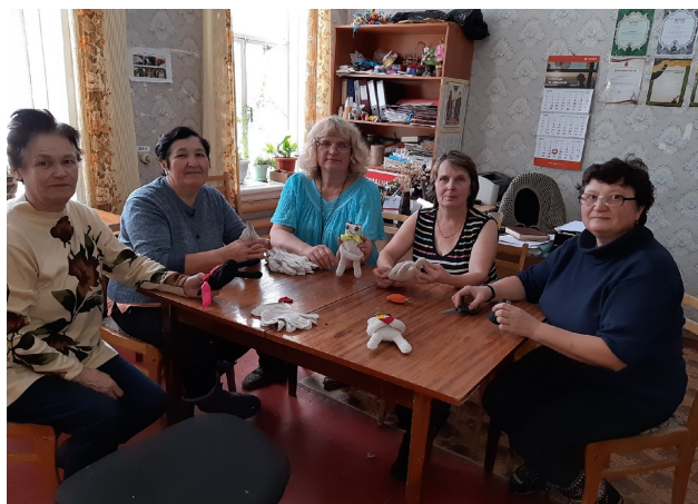
Слушательницы Школы пожилого возраста из Висимо-Уткинска благотворительно изготовили котиков-игольниц

В преддверии Международного дня инвалидов специалистами отделения социального обслуживания населения № 5 с волонтерами серебряного возраста - представителями старшего поколения поселка Висимо-Уткинск проведен мастер-класс по изготовлению «Котиков-игольниц».