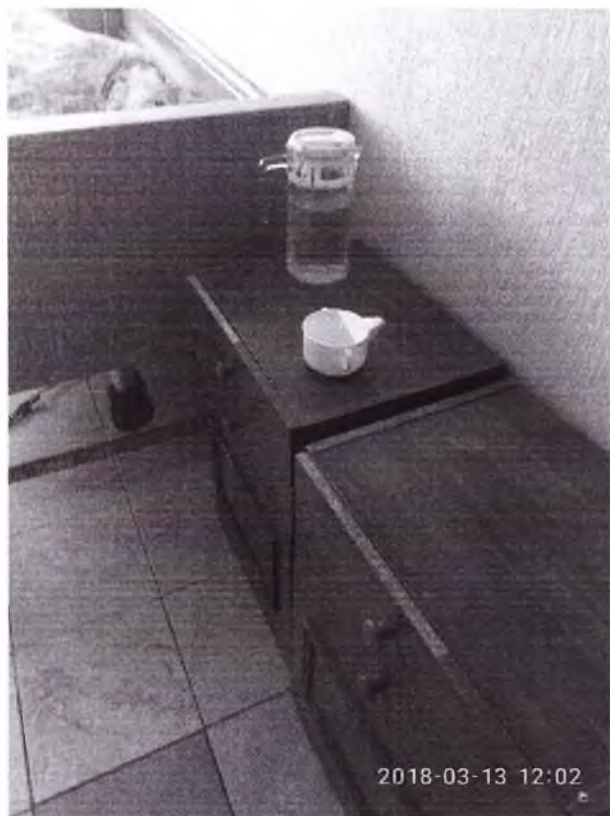
Рис. 1 Тумбочки с повреждением поверхности покрытия

В комнатах №№ 17, 19, 20, 22 покрытие мебели (покрытие тумбочек) не обеспечивает возможность проведения влажной уборки с применением моющих и дезинфицирующих средств, а именно: имеются множественные сколы в покрытии поверхности тумбочек, что является нарушением п. 6.2 СП 2.1.2.3358-16 "Санитарно-эпидемиологические требования к размещению, устройству, оборудованию, содержанию, санитарно-гигиеническому и противоэпидемическому режиму работы организаций социального обслуживания", согласно которого В организациях социального обслуживания используются оборудование и мебель, покрытие которых обеспечивает возможность проведения влажной обработки с применением моющих и дезинфицирующих средств. При использовании мягкой мебели предусматриваются съемные чехлы (не менее 2 комплектов) с обязательной стиркой их по мере загрязнения, но не реже один раз в месяц.