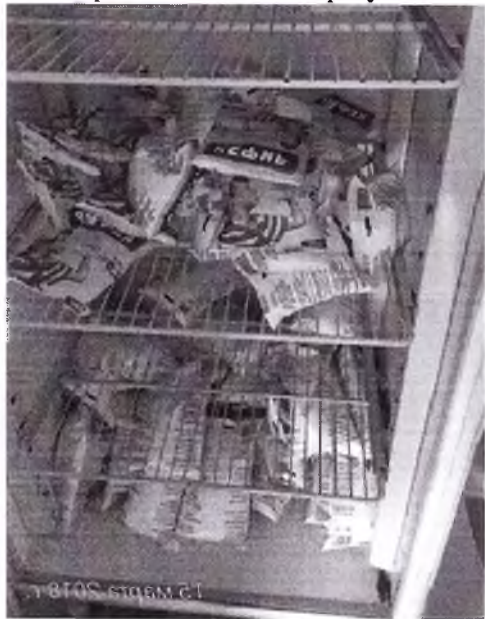
Рис. 2 хранение молочной продукции в холодильнике

Молочная продукция: молоко кефир, производителя АО «ТМК Надежда», Слободо-Туринский район, с. Туринская Слобода, ул. Заводская, 45, должна храниться 2-6 градусов выше нуля (согласно маркировке производителя, ТР ТС 021/2011). В данном случае молочная продукция согласно градусника приложенного к продукции внутри холодильного оборудования показывает 8 градусов выше нуля, что выше условий хранения установленных производителем и может привести к порче продукции, либо риску отравления граждан содержащихся и питающихся в данном учреждении. Что не соответствует предусмотренным требованиям для хранения молочной продукции, и является нарушением п. 7 ст. 17 ТР ТС 021/2011 "О безопасности пищевой продукции" согласно которого при хранении пищевой продукции должны соблюдаться условия хранения и срок годности, установленные изготовителем. Установленные изготовителем условия хранения должны обеспечивать соответствие пищевой продукции требованиям настоящего технического регламента и технических регламентов Таможенного союза на отдельные виды пищевой продукции.