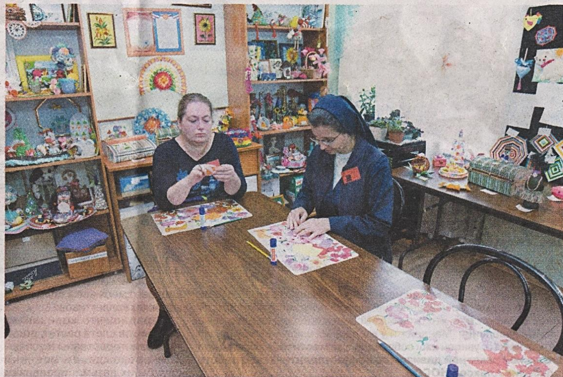
Занятие в студии «Мастерица».