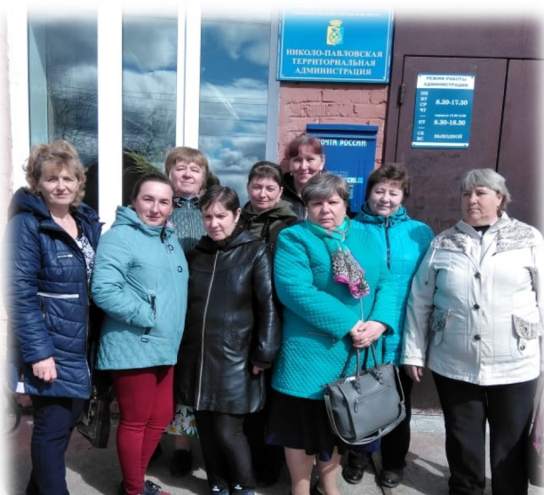
Социальные работники отделения социального обслуживания № 2

Вера Андреевна, спасибо Вам за важные решения, за доброту, поддержку, понимание! Нам с Вами очень повезло! С юбилеем!