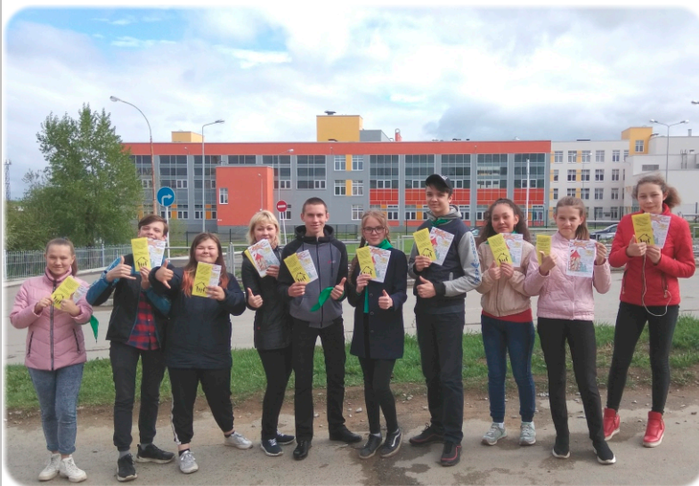
Волонтеры акции «Подари улыбку детям!»

Летние каникулы, Ура! Ура!! Ура!!! Ликует детвора. Трёхкратное «Ура»! Во всех концах двора. Каникулы! Каникулы! С утра и до утра. Каникулы! Каникулы! Ура! Ура!! Ура!!! Глядит светило радостно На детский шум и гам, наращивая градусы, Волнуя пап и мам. Коль солнцем, будто кушаньем, По горло сыт, тогда С обливами и душами Во двор придёт вода. Каникулы! Каникулы с утра и до утра. За наши, за каникулы Ура! Ура!! Ура!