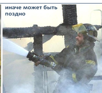
иначе может быть поздно

Быть хозяином дома – значит отвечать за его безопасность