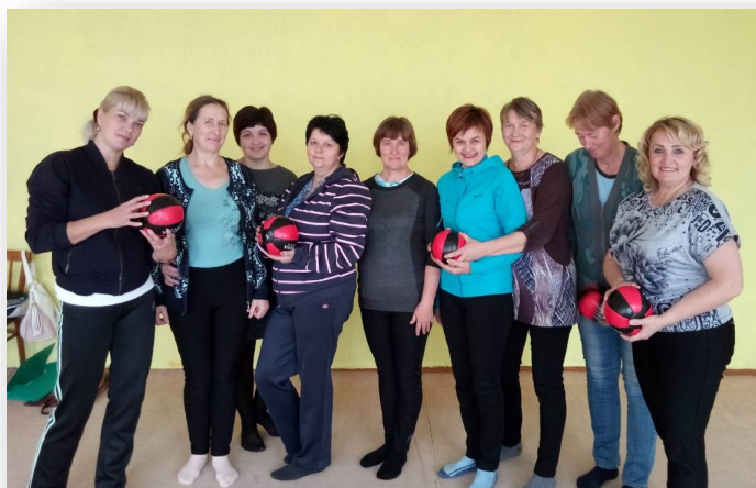
Социальные работники отделения социального обслуживания № 3 освоили навыки профилактики эмоционального выгорания

состоянии стресса нам кажется, что забота о себе — последнее, на что нужно тратить время. Однако, как раз собой не стоит пренебрегать. Когда человек чувствует, что до выгорания недалеко, особенно важно хорошо питаться, пить много воды, заниматься спортом и высыпаться.