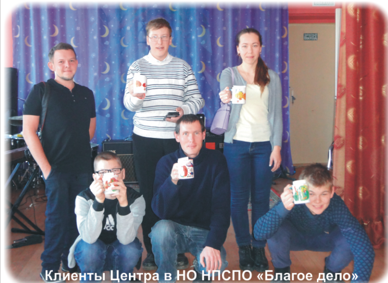
Клиенты Центра в НО НПСПО «Благое дело»

Слово – удивительный дар, которым обладает только человек. Это могучее средство самовыражения и самопознания. Есть такое поверье: выпущенное слово само по себе живёт и имеет особую силу. Слово, неправильно сказанное, неправильно и существует. Оно, будто мрачная туча, висит над человеком! Грубое слово ранит, доброе – лечит, помогает.