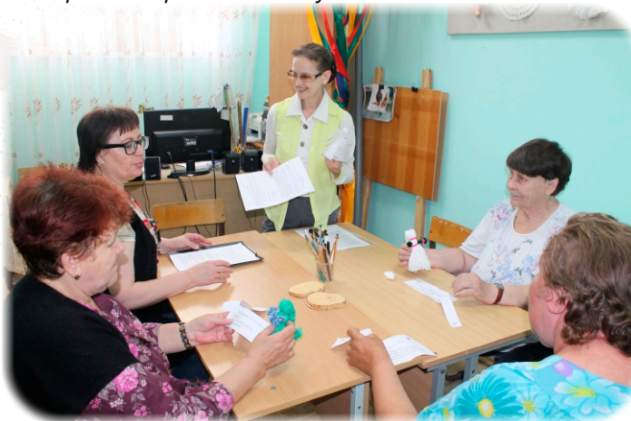
Одно из занятий клуба.