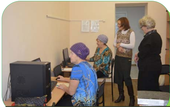
Стать уверенным пользователем компьютера в пенсионном возрасте возможно!