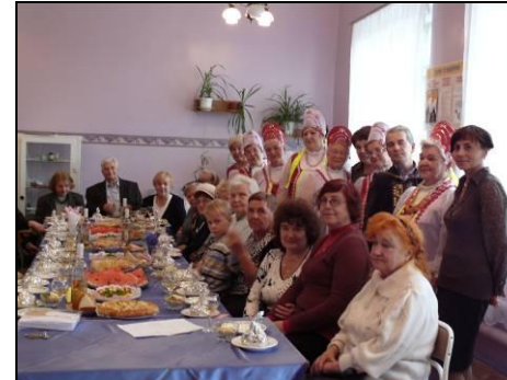
Выступления ансамбля «Вишенка»