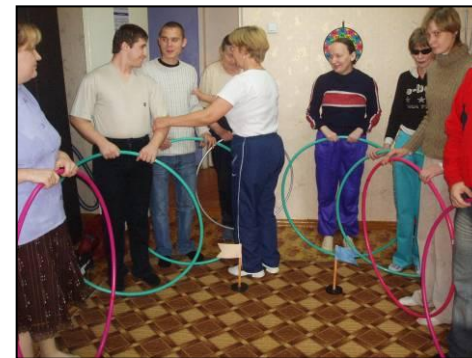
Занятия с инвалидами в клубе «Здоровый образ жизни»