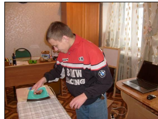
Занятия по социально – бытовой реабилитации (обучение навыкам самообслуживания)