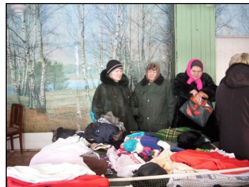
Выезд мобильной бригады в Каменский район