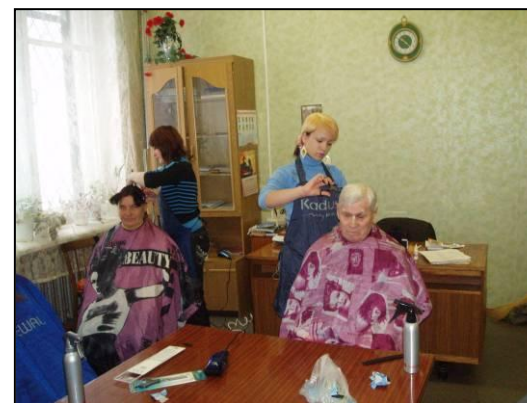
Проведение акции «Красота в подарок»