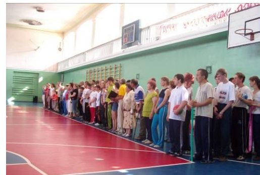
Участие молодых инвалидов с психическими расстройствами в городской спартакиаде