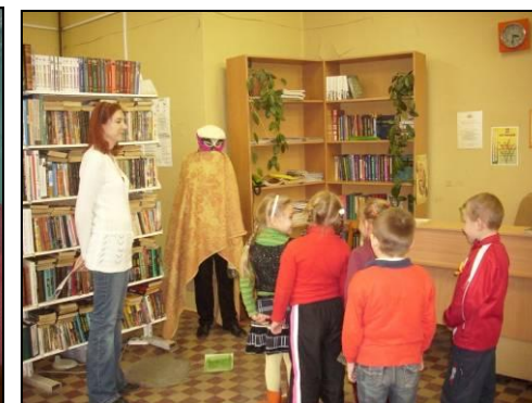
Занятия с детьми по проекту «Возрождение семьи»

Проведены лекции в общеобразовательных школах: