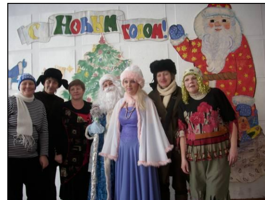
Проведение акции «Стань Дедом Морозом»