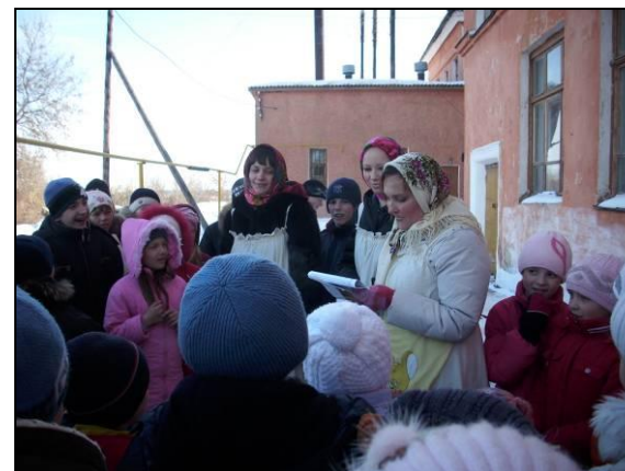
Проведение «Масленицы» на социальных участках города

Организация гастролей театрализованного коллектива «Вишневый сад» с показом спектакля «Матушкино благословение» - 188 человек ;