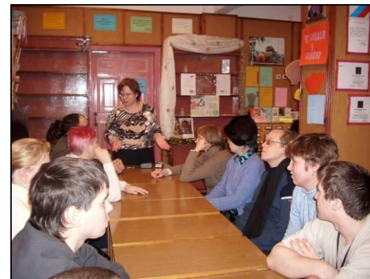
Экскурсии в библиотеку «Духовного возрождения»