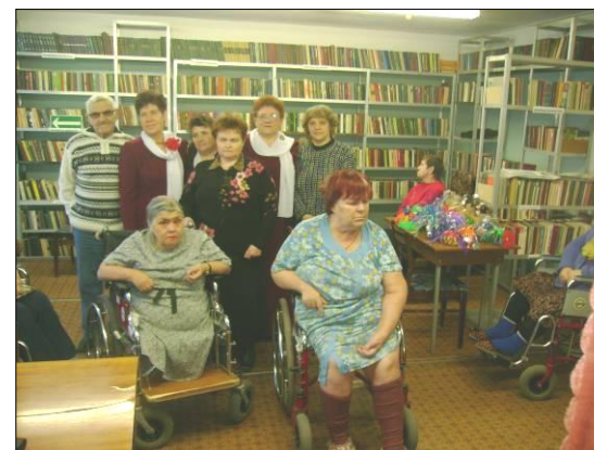
Мини-клубы, созданные на социальных участках города