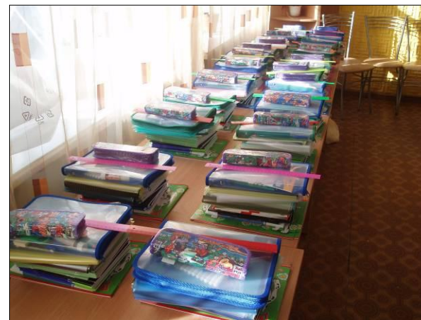
Проведение акции «Здравствуй школа!»