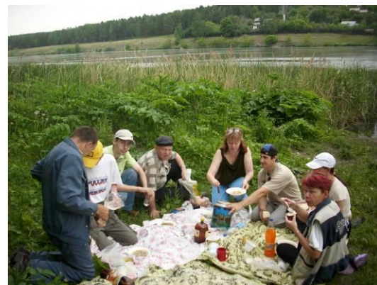
Поход с инвалидами на реку