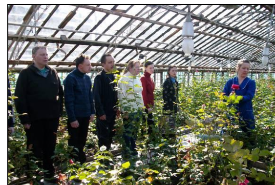
Экскурсия в оранжерею