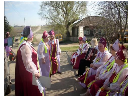
Участие ансамбля «Вишенка» в выездном мероприятии «Автобус Надежды»