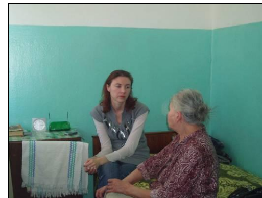
Формы работы психолога с населением

Проведено 14 индивидуальных консультаций , в том числе на дому по проблемам: