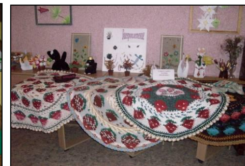
Посетители кружка «Умелые ручки»