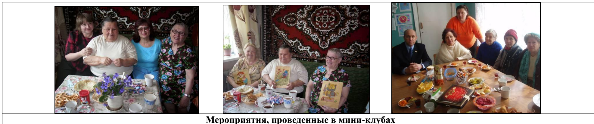
Мероприятия, проведенные в мини-клубах

Одной из инновационных форм работы с пожилыми людьми и инвалидами в отделениях социального обслуживания на дому в 2009 года стало создание бригад в некоторых отделениях.