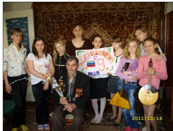
Проведение акции «Праздник в доме»

В течение 2009 года участковые специалисты по социальной работе принимали активное участие в организации и проведении досуговых мероприятий на территории социальных участках с различными группами населения: