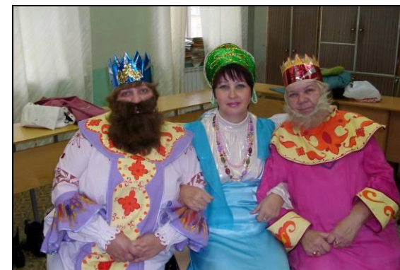
Коллектив театральной студии «Вишневый сад»