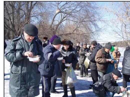
Обеспечение горячим питанием граждан Бомж