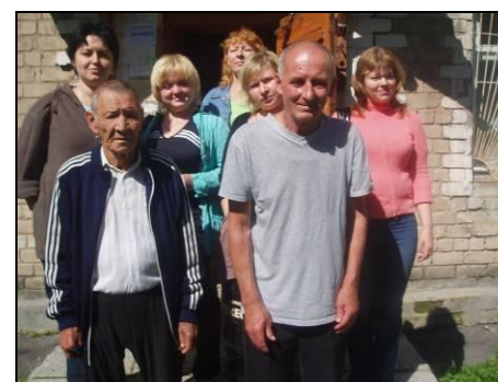
Сотрудники и клиенты социальной гостиницы