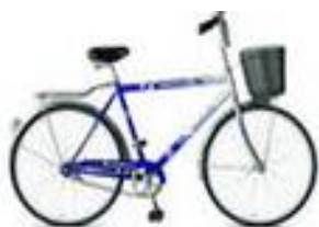
Велосипед дорожный взрослый