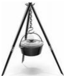
Тренога и котел 4,5л.