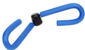
Эспандер Тай Мастер

Велотренажер для нижних конечностей предназначен для разработки нижних конечностей пациентов в период реабилитации или инвалидов. Тренирует ослабленные мышцы, улучшает кровообращение в конечностях.