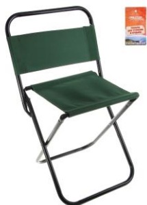
Стулья туристические складные