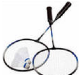
Ракетки для бадминтона