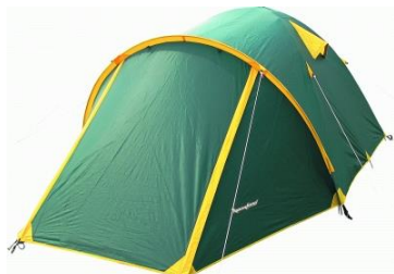
Палатка 4-х местная

Туризм — это активный образ жизни, является уникальным средством восстановления физических и духовных сил человека, повышения уровня здоровья и работоспособности, через туризм осуществляется терапия и профилактика психосоматических заболеваний, поддержание физической формы.