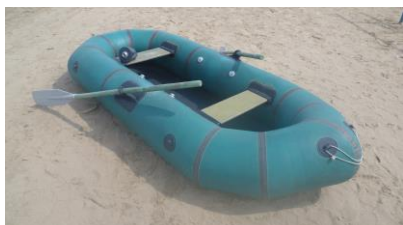
Лодка 2-х местная