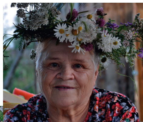
сейчас бабушке 77 лет