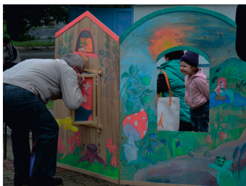
И без солнца светло от улыбок!