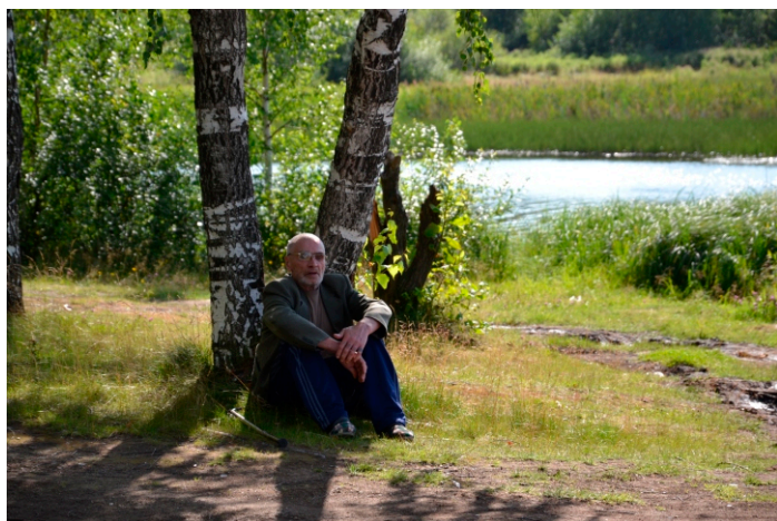
отдых у Кировградского пруда

Как ясен август, нежный и спокойный, Сознавший мимолетность красоты. Позолотив древесные листья, Он чувства заключил в порядок стройный. В нем кажется ошибкой полдень знойный,- С ним больше сродны грустные мечты, Прохлада, прелесть тихой простоты И отдыха от жизни беспокойной.