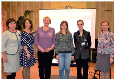
члены жюри довольны результатами конкурса!

18 сентября были подведены итоги этого конкурса. В номинации «Лучшее корпоративное издание учреждения социального обслуживания населения» победила наша газета «Изумруд»! Материалы направлены в Организационно-методический центр (г.Екатеринбург) для участия в следующем этапе конкурса.