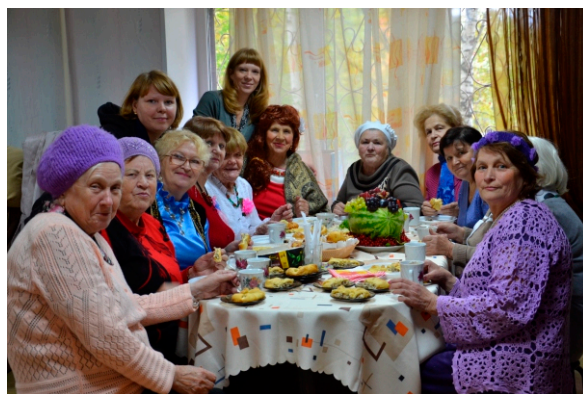
клубницы - элегантные хозяйюшки!

Сегодня, отмечая Международный день пожилого человека, можно в очередной раз восхититься и активностью наших пенсионеров. Для заинтересованного участия клубников, клиентов отделений Центра «Изумруд» в сентябрьских мероприятиях была разработана насыщенная, разнообразная по видам деятельности программа Месячника пожилого человека.