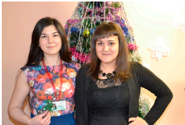
«Надежда» начинается с улыбок

Декабрьское 2015 года заседание клуба было посвящено вопросам эмоционального выгорания приёмных родителей и способов выхода из эмоционально-кризисных ситуаций. Взрослые участники встречи проявили активность, а я как педагог-психолог содействовала их общению, направляла ход мероприятия в нужное русло, чтобы