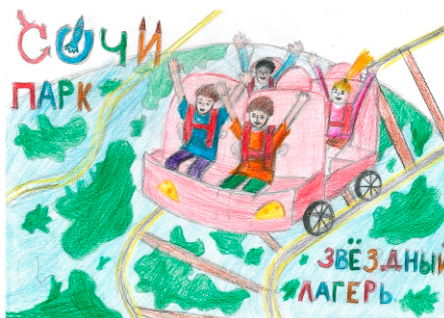
Новый рисунок Стаса

Вот что написали Стас и его мама – Людмила Леонидовна, побывавшие в