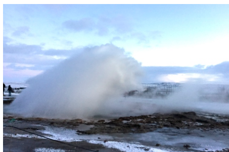
Один из гейзеров

С вулканической деятельностью связаны разбросанные по всей Исландии гейзеры, термальные источники (их насчитывается примерно 7 тысяч). Энергия горячих источников используется для обогрева домов, для подачи теплой