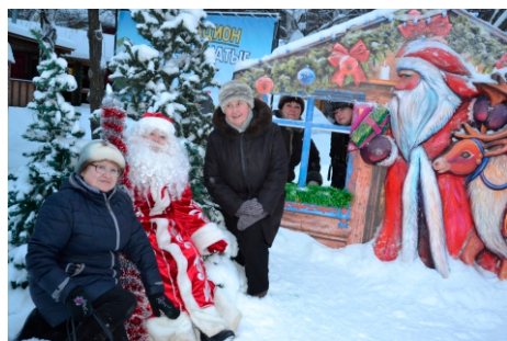
Поверили в сказку

Вторая остановка – главная областная ёлка в «Ледовом городке». В центре городка – зелёная красавица. Хоть и искусственная, но самая большая ёлка на Урале высотой – 46 метров! В этом году она была украшена гирляндой в пять тысяч светодиодных лампочек с восемнадцатью оттенками. Красота!