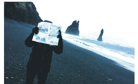
Газета «Изумруд» на знаменитом «Чёрном пляже»