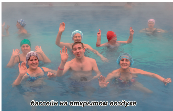
бассейн на открытом воздухе

Многие направления ШПВ уже известны нашим читателям.