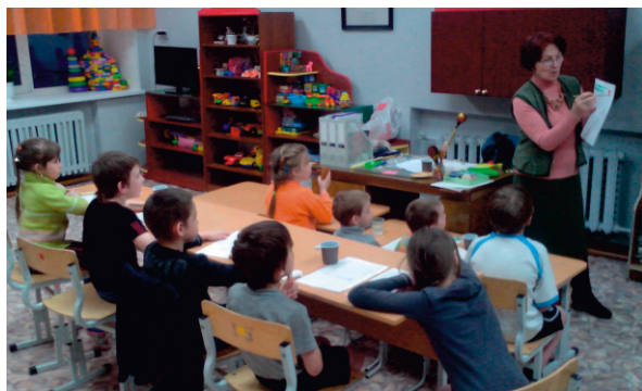
занятие в младшей группе

Творческий процесс – дело увлекательное, никто и не заметил, как пролетело время! Потому так горели глаза ребят, а на лицах расцветали улыбки, ведь новое дело вдохновляет, вызывает интерес к работе, к творчеству, к жизни. Пусть же каждое начинание сопровождается успехом, а результаты радуют!