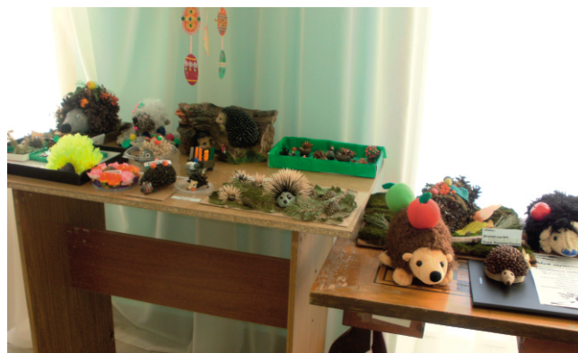
мини-выставка в отделении общего типа

А как быть тем, кто не решился «презентовать» себя, участвуя в конкурсе, кто не смог выехать на природу? Что ж, не беда: природа и презентации сами «пришли» к гражданам пожилого возраста – клиентам отделения общего типа Центра «Изумруд»!