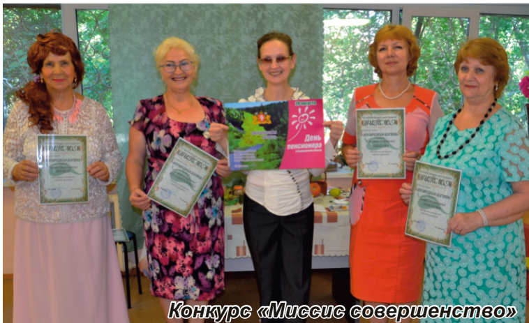
Конкурс «Миссис совершенство»

В последнее воскресенье августа в Свердловской области традиционно отмечается праздник – День пенсионера. Именно с этого дня стартует Месячник пенсионеров, в рамках которого предусмотрены самые разнообразные мероприятия для граждан пожилого возраста.