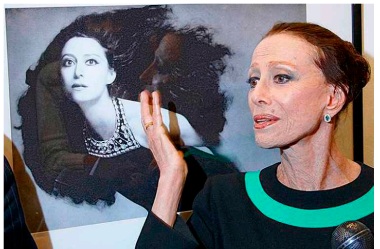
двойной портрет Майи

И это относится не только к танцу Плисецкой в «Кармен». Побывав на «Раймонде» поэт воскликнул: «Изумление гения среди ординарности – это ключ к каждой её партии»