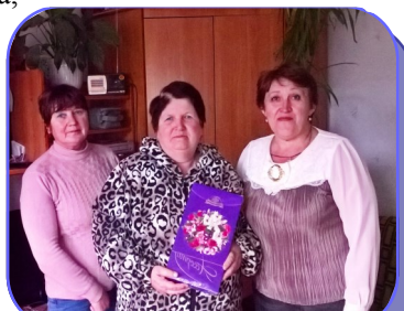
Сладкими подарками поздравили и ветеранов Центра