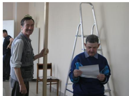
На фото: идет монтаж фотовыставки