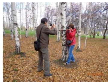
На фото: один из последних пленэров в парке Первоуральска