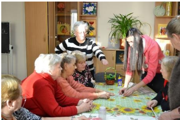
На фото: мастер-класс с участием волонтеров

пожилые люди и инвалиды занимаются рукоделием.