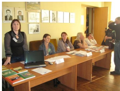
На фото: информационные материалы о ШПВ для пожилых людей

рукоделию, по социальному туризму, а также для материалы для сценариев новых театральных постановок и приносят к нам, в центр «Осень», чтобы передать свои знания, умения и навыки новым друзьям. Во время совместных поездок в рамках социального туризма, участники различных клубов делятся впечатлениями, передают друг другу новости о понравившихся им мероприятиях, проводимых на базе нашего центра. В ходе работы «Информационных киосков», проводимых во время городских массовых мероприятий, пожилые люди также получают всю информацию об организации работы клубов и «Школы пожилого возраста».