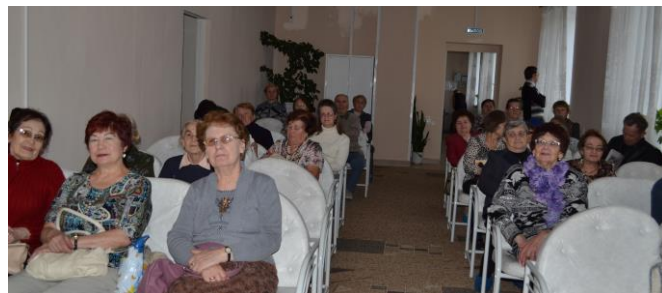
На фото: любители «Виртуальной филармонии» перед концертом.

«Белая сирень», в театральной студии «Вдохновение». Клуб любителей классической музыки «Музыкальная гостиная» собирается в дни трансляции виртуальных концертов.