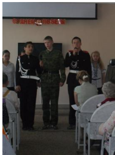
На фото: выступают кадеты школы №3

Мы готовимся к празднованию 70 – летия Дня Победы, поэтому сейчас так важен лозунг «Никто не забыт и ничто не забыто!» Специалисты планируют в течение 2015 года проводить совместно с членами Добровольческого штаба и волонтерами молодого поколения ежемесячно на территории всех участков тематические мероприятия и социальные акции на дому, посвященные ветеранам.