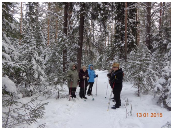
На фото: на «Тропе здоровья» в п.Новоуткинск

Любители местного туризма собираются в клубе «Странник» и на «Тропе здоровья».