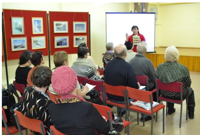
На фото: занятия по садоводству

Занятия по направлениям «Школы пожилого возраста» проводятся с активным участием наших постоянных социальных партнеров из учреждений культуры и общественных организаций.