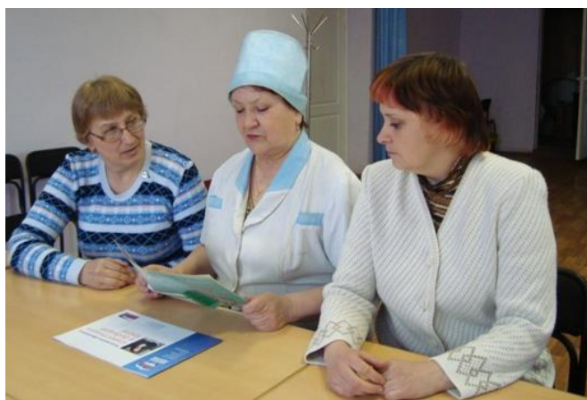
На фото: обсуждение материалов для занятий с волонтерами «Красного креста»

Занятия по направлениям «Школы пожилого возраста» проводятся с активным участием наших постоянных социальных партнеров из учреждений культуры и общественных организаций.