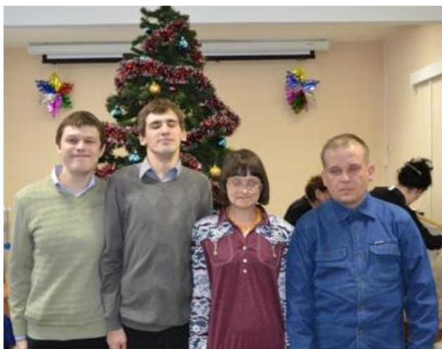
На фото: актив клуба «Бригантина надежды»

Проходят репетиции в творческих ансамблях «Огонек», «Березка», «Ретро»