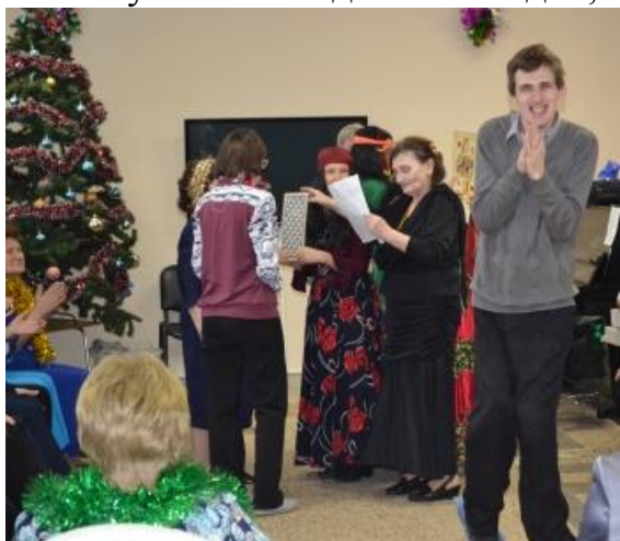
На фото: участники клубов «Бригантина надежды» и «Вдохновение» на общем мероприятии.

Клуб «Бригантина надежды» создан и работает уже 10 лет для инвалидов;