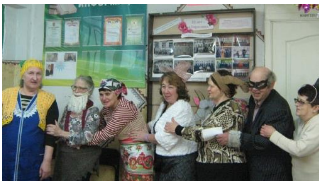
На фото: новогоднее мероприятие «А у нас в Святки свои порядки» в п.Вересовка

В начале января произошли изменения в клубной деятельности - начал работу еще один клуб «БРИЗ», организованный в поселке Вересовка. Подробнее о клубной работе и о занятиях в «Школе пожилого возраста» на отдаленных территориях читайте на следующих страницах.