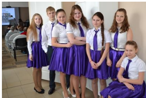
На фото: волонтеры из Лицея №21

Школьники – вокалисты из лицея №21 успешно выступили недавно на европейской сцене. Но, по признанию ребят, не меньше волнения у них было перед выступлением для ветеранов. В результате, на встрече лирические песни исполняли все вместе!