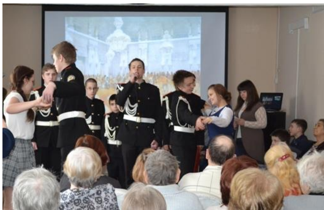
На фото: волонтеры – кадеты школы №3

Переполненный зал не вмещал всех желающих посмотреть концертную программу. Кадеты показали композицию «Жизнь - Родине, честь - никому», слайд – фильм об организации кадетского движения в России. Бальные танцы всегда сопровождают такие мероприятия, поэтому проведение ежемесячно встречи ветеранов и волонтеров на «Балах ветеранов», надеемся, станут доброй традицией в Центре (на фото).