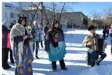
На фото: веселые эстафеты

хороводы, участвовали в ритуале сожжения Масленицы, а потом все вместе пили чай.