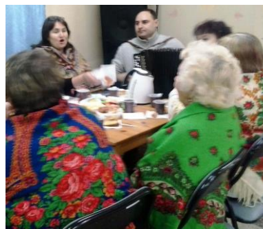
На фото: песенные посиделки актива клубов с. Новоалексеевское