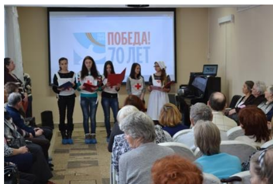
На фото: выступают волонтеры Красного Креста

Школьники – вокалисты из лицея №21 успешно выступили недавно на европейской сцене. Но, по признанию ребят, не меньше волнения у них было перед выступлением для ветеранов. В результате, на встрече лирические песни исполняли все вместе!