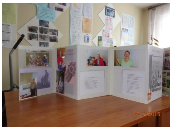
На фото: выставки – передвижки о судьбе ветеранов Великой Отечественной войны.

В городском округе Первоуральск этим датам были посвящены праздничные мероприятия: как городские, так и встречи с ветеранами в отделениях нашего Центра. Фоторепортажи о проведенных мероприятиях можно увидеть на страницах 2, 3 и 4.