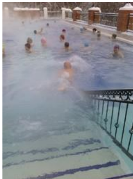
На фото: в термальном бассейне «Баден – Баден» около города Реж.

Надо отметить, что работа клубов по интересам «Странник» и «Фотолюбитель» в этом году стала заметно активнее. Так, после летнего перерыва знатоки фотосъемки начали собираться не один раз в месяц, а каждый четверг. На большом экране они просматривают кадры, снятые во время проведения мероприятий в центре «Осень», во время экскурсий и прогулок по интересным местам, обсуждают композиционные решения. Регулярно проводятся мастер – классы для начинающих фотолюбителей.