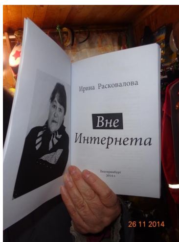
На фото: авторская книга жительницы поселка Новоуткинск.

Именно так называлось массовое мероприятие для жительниц поселков Новоуткинск, Прогресс, села Слобода. В местном клубе собрались все вместе: стар и млад, чтобы показать на творческой выставке свои работы, а на сцене – продемонстрировать свои певческие и поэтические таланты. А показать есть что! У наших бабушек издаются книги их литературных произведений: стихов и рассказов!