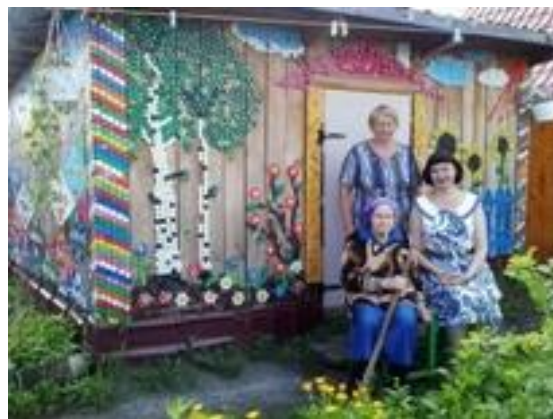
На фото: летняя экскурсия на садовый участок одной из слушательниц ШПВ в поселке Новоалексеевское.

В 2014 году отмечается юбилей Свердловской области, поэтому многие мероприятия были посвящены юбилейной дате: организованы в течение года 4 фото – выставки, проведены 5 мероприятий в рамках проекта «Виртуальные путешествия» и 16 бесед об истории образования области.