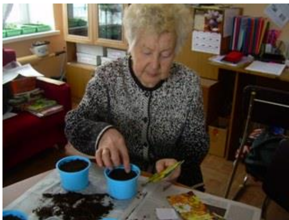
На фото: практические занятия в селе Новоалексеевское.

В отделении «Садоводство и огородничество» занятия начались еще в феврале на сельских территориях. В селе Новоалексеевском и в поселке Билимбае 22 слушателя не только получили теоретические знания по основам грамотной посадки растений, ухода за ними и сбора урожая, но и правильного поведения на участках во избежание несчастных случаев при работе с садовым инвентарем. Уход за садовым участком должен приносить только радость! Поэтому слушательницы охотно делились рецептами блюд из выращенных плодов на совместных посиделках после занятий, ходили друг к другу в гости на садовые участки. В ноябре эстафету приняли 16