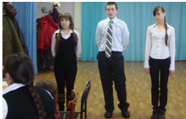
На фото: ветеранов приветствует молодежь поселка Билимбай.

Ветераны тыла, вдовы участников Великой Отечественной войны с огромной радостью принимают в дар сувениры из детских рук, их искреннее внимание во время встречи с ветеранами в рамках акции «Связь поколений».