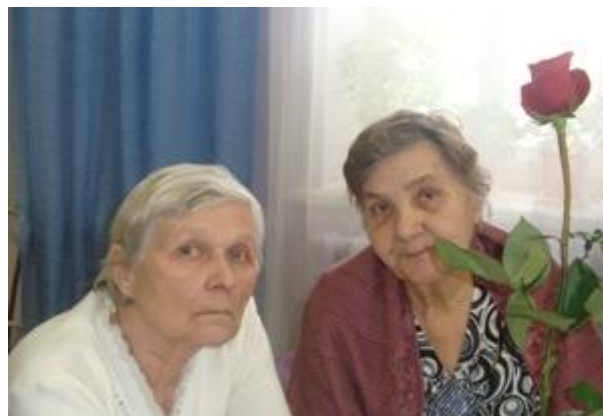
На фото: ветераны поселка

Не все желающие смогут принять участие в празднике, среди них – маломобильные пожилые люди, которые оставили свой неизгладимый след в развитии поселка. Совет ветеранов поселка помог сформировать список маломобильных пожилых людей, которые хотят соприкоснуться с юбилейными событиями, но имея проблемы в передвижении, не смогут выйти за пределы своего жилья.