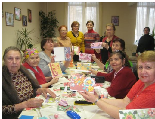
На фото: участницы клуба «Рукодельница» и волонтеры из художественно школы.

Нет пределов мастерству наших бабушек! Мастер – классы и выставки творческих работ, уже традиционно проводимые в отделениях центра «Осень», собирают все больше участниц и молодых волонтеров. Учащиеся художественной школы, Первоуральского политехникума, детских дворовых клубов с удовольствием обучают новым технологиям рукоделия наших бабушек, а также охотно учатся у них основам вязания и оригами.