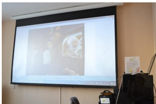
На фото: на экране представлены экспонаты Музея золота в городе Березовский.

К организации и проведению различных по форме мероприятий привлекаются активные люди старшего поколения, которые имеют возможность участвовать в экскурсионных поездках по Уральскому краю в рамках социального туризма. А пожилые люди, с ограничениями по здоровью, клиенты центра «Осень», «путешествуют» виртуально.