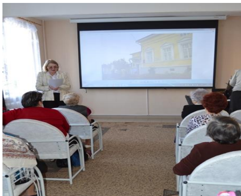
На фото: участники и зрители «Виртуальных путешествий».

4 ноября Россия празднует День народного единства. В честь праздника были оформлены информационные стенды, проведены беседы в клубах по интересам и тематическое мероприятие для пожилых граждан в рамках социального проекта «Виртуальные путешествия». Подробнее о реализации проекта можно узнать на странице 2.