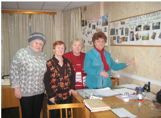
На фото: активисты Совета ветеранов

Пожилые граждане, поверив в свои силы, по рекомендации уже обучившихся знакомых активно записываются на обучение. Очередь желающих к