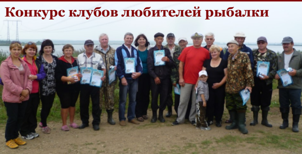
Конкурс клубов любителей рыбалки