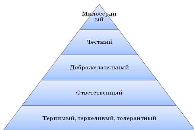
Рис. Идеальный социальный работник

Далее проанализируем блок вопросов, касающийся личности и квалификации сотрудников. Так, основное качество социального работника – это терпимость, толерантность по отношению к клиентам. Второе основное качество – ответственность. Третье необходимое качество – доброжелательность, коммуникабельность, которые необходимы для эффективного диалога с клиентами. Также идеальному социальному работнику необходимы честность и милосердие, сострадание, отзывчивость к проблемам клиента. Если сравнить два профиля, то видно, что реальный социальный работник менее вежливый, менее милосердный, менее терпимый, но более ответственный чем идеальный. Реальный социальный работник обладает идеальной общительностью и доброжелательностью. Реальным сотрудникам присущи качества, которые не являются необходимыми для идеального социального работника: выносливость, организаторские способности, дисциплинированность, аналитическое мышление, жизнелюбие, изобретательность, исполнительность и т.п.