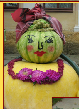
Конкурс клубов садоводов «Золотая осень»