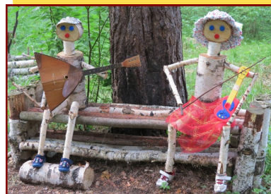
«Ландшафтный дизайн территорий»