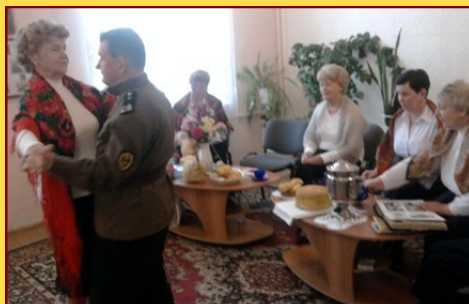
Пожелаем участникам клуба «Вдохновение» ПОБЕДЫ в фестивале клубного движения!