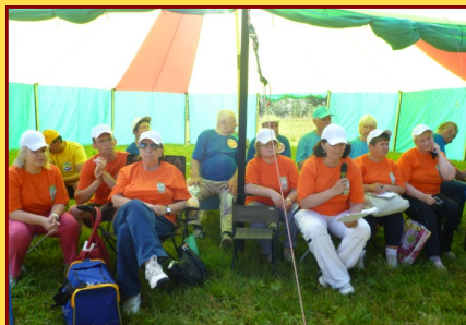
Конкурс туристических клубов