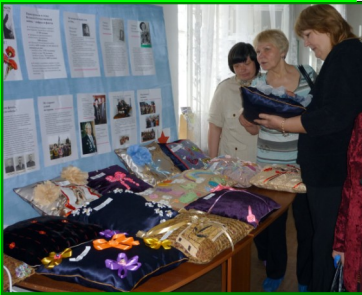
Акция «Верим. Помним. Бережем.», выставка декоративных подушек