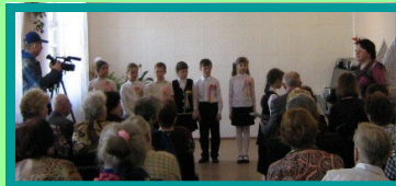
Волонтеры: учащиеся общеобразовательных учреждений города