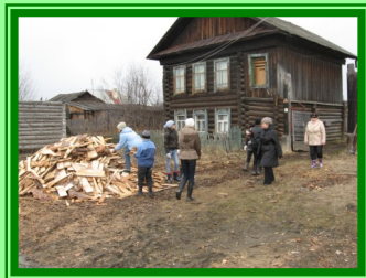
пос. Новоуткинск. Акция «Чистый двор» по уборке дворов инвалидов и ветеранов ВОВ с участием волонтеров – школьников МОУ

Весной, в апреле, в канун великого праздника Победы, специалисты по социальной работе участковой службы Центра «Осень» и волонтеры городского округа Первоуральск объединили усилия, чтобы как можно больше добрых дел было совершено для пожилых граждан, ветеранов войны, инвалидов и людей, находящихся в трудной жизненной ситуации.