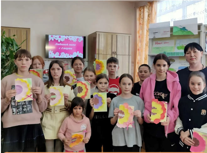
Ребята с удовольствием поучаствовали в мастер-классе

Несмотря на то, что зима еще не спешит сдавать свои позиции, воздух уже наполнен предвкушением весны и, конечно, самым нежным праздником – Международным женским днем. Этот день – символ пробуждения природы, красоты и женственности, а также прекрасный повод выразить свою любовь и признательность самым дорогим людям – нашим мамам.