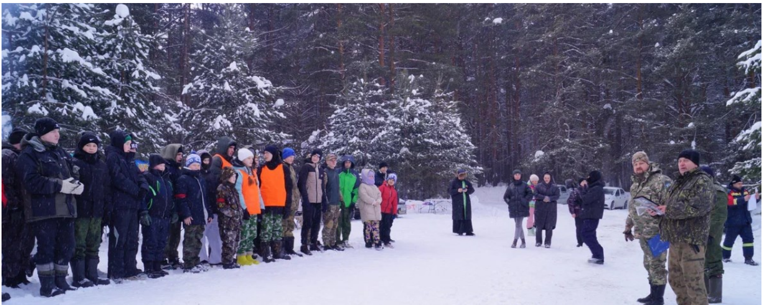
Участники VI Областной Зарницы «Патриоты-2026»