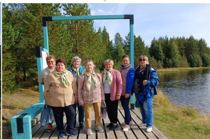
Участники литературного похода