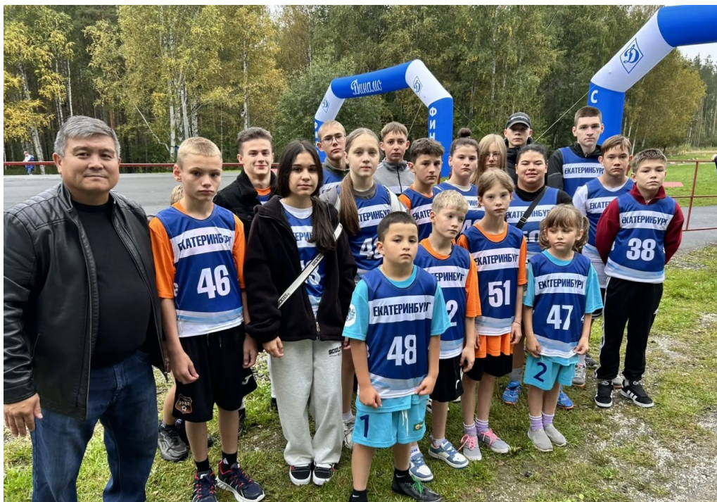
Спортивная команда воспитанников