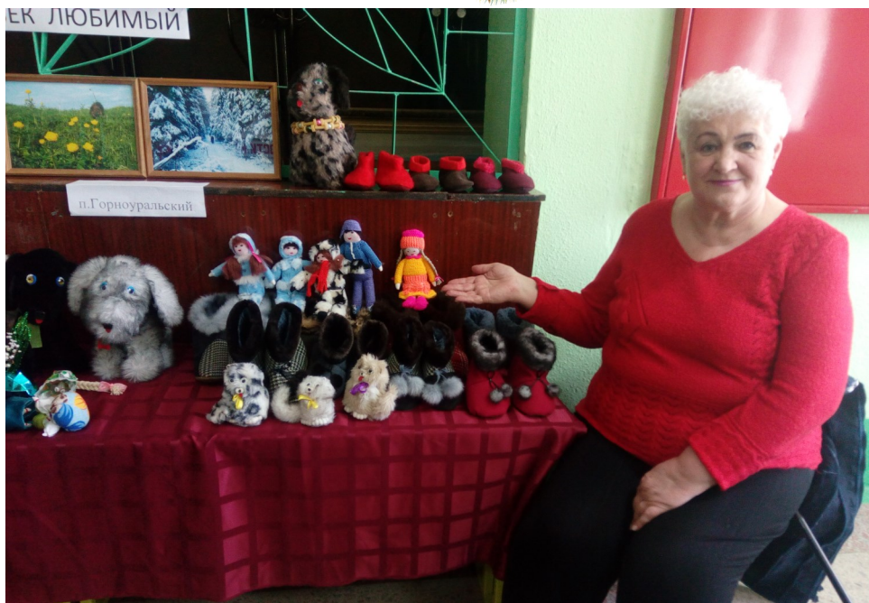
Подделки Лидии Корнеевны