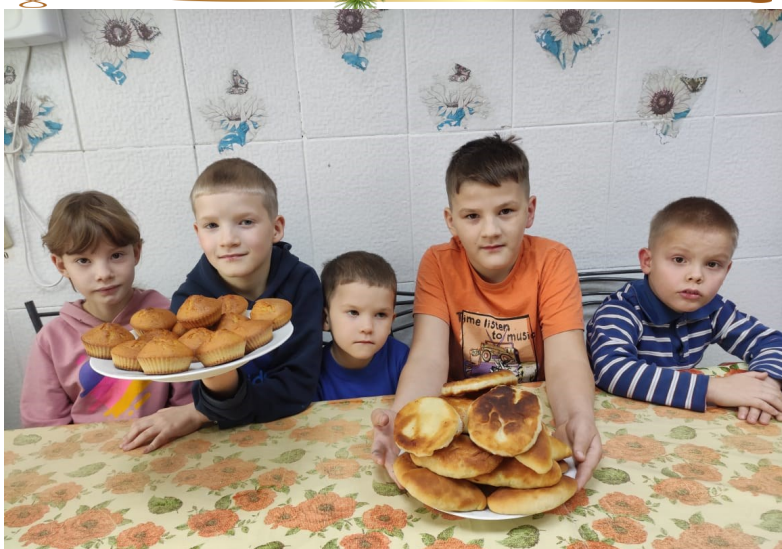
Печем пироги сами!