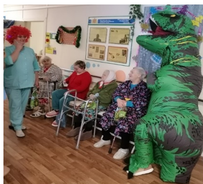
Фото с костюмированной вечеринки по случаю празднования Нового года. На снимке видно, что в мероприятии принимают участие все клиенты. Лица их радостны, они смеются.

Приведем другой пример. Клиент и юный волонтер получили призы за совместное участие в мероприятии. Данное фото говорит само за себя. Искренняя радость общения отражается на лицах людей, изображенных на фотографии.