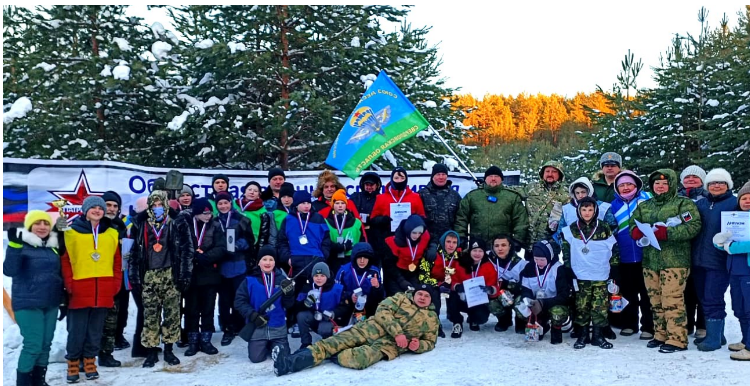
Участники пятой Областной игры Зарница «Патриоты—2024»