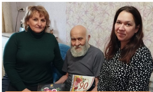
Юбилей в окружении специалистов отделения социального обслуживания на дому №3