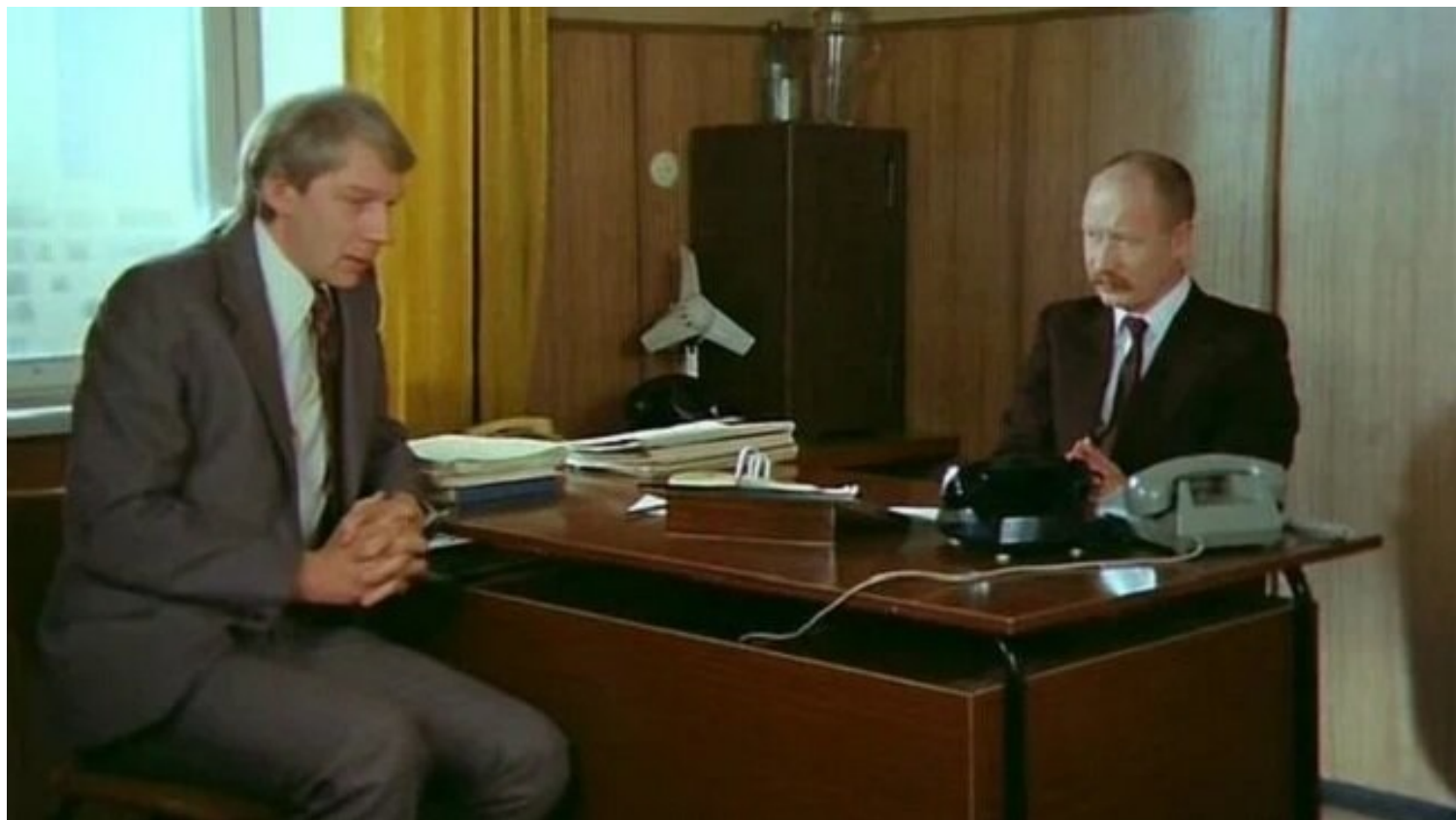
Кадр из фильма - "Взятка"