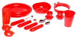
Специальная посуда для детей с нарушением опорно-двигательного аппарата

Консультация врача-педиатра (по показаниям).