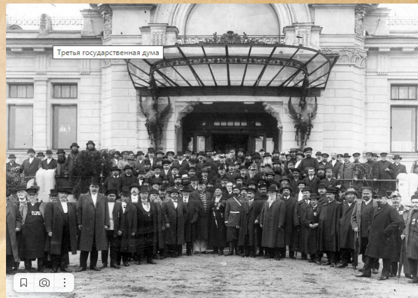
На рисунке: Третья государственная дума (совместное фото) (кликабельно)

На рубеже XIX - XX вв. сделаны первые шаги в области социального страхования рабочих. Один за другим вышли законы, регламентирующие труд женщин и подростков на промышленных предприятиях, о вознаграждении потерпевших вследствие несчастных случаев рабочих, служащих и членов их семей, в предприятиях фабрично - заводской, горнозаводской промышленности. В 1912 году III Государственная Дума приняла четыре социальных закона: о страховании рабочих от несчастных случаев, о страховании на случай болезни, об учреждении присутствий по делам страхования рабочих, об учреждении совета по делам страхования рабочих.