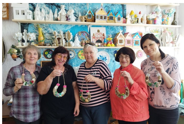
В конце занятия рукодельницы сделали на память общее фото

Забота о пожилых гражданах — главная цель Комплексного центра социального обслуживания населения Пригородного района.