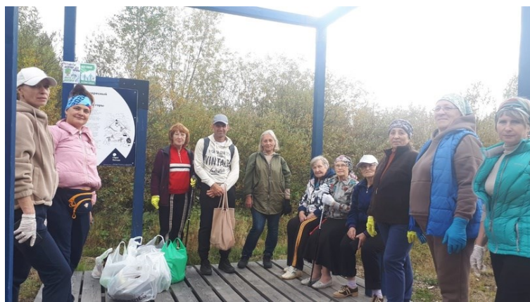
Участники «Скандинавской прогулки» остались довольны туристическим путешествием