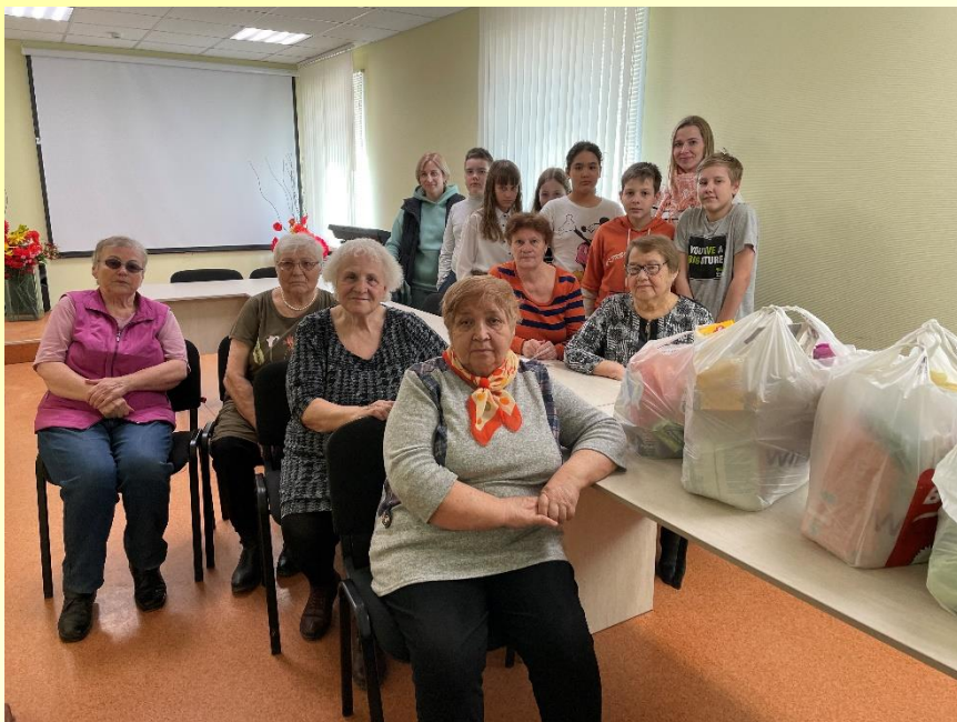
«Весенняя неделя добра» - 2022, Центр общественных организаций (ВОС, ВОИ, Гимназия №5)