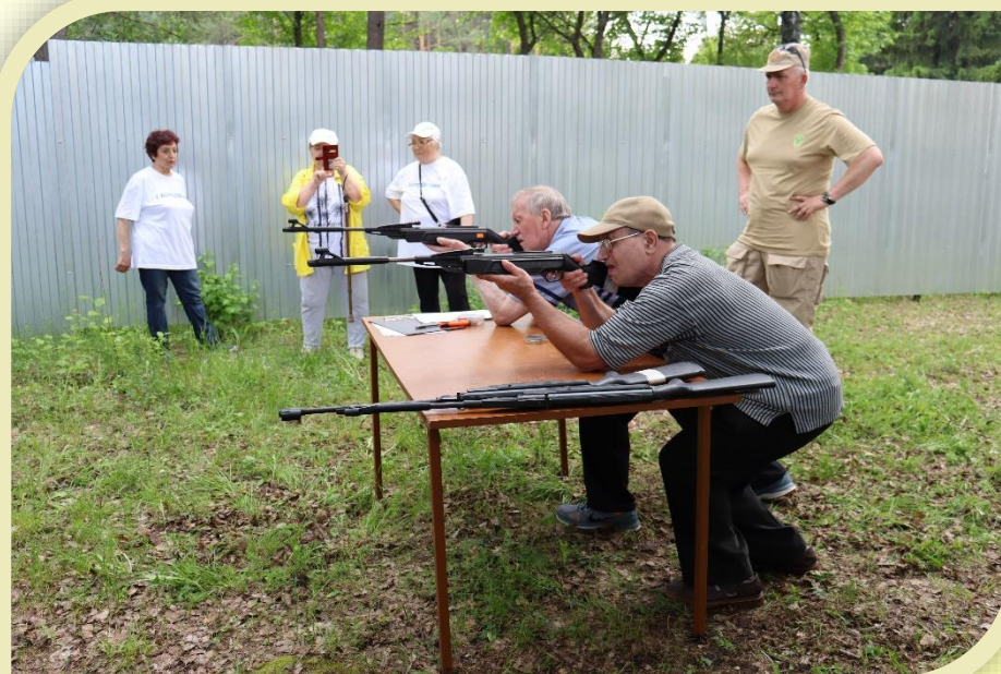
Военно-спортивная игра «Зарница» - 2022, команда ВОИ