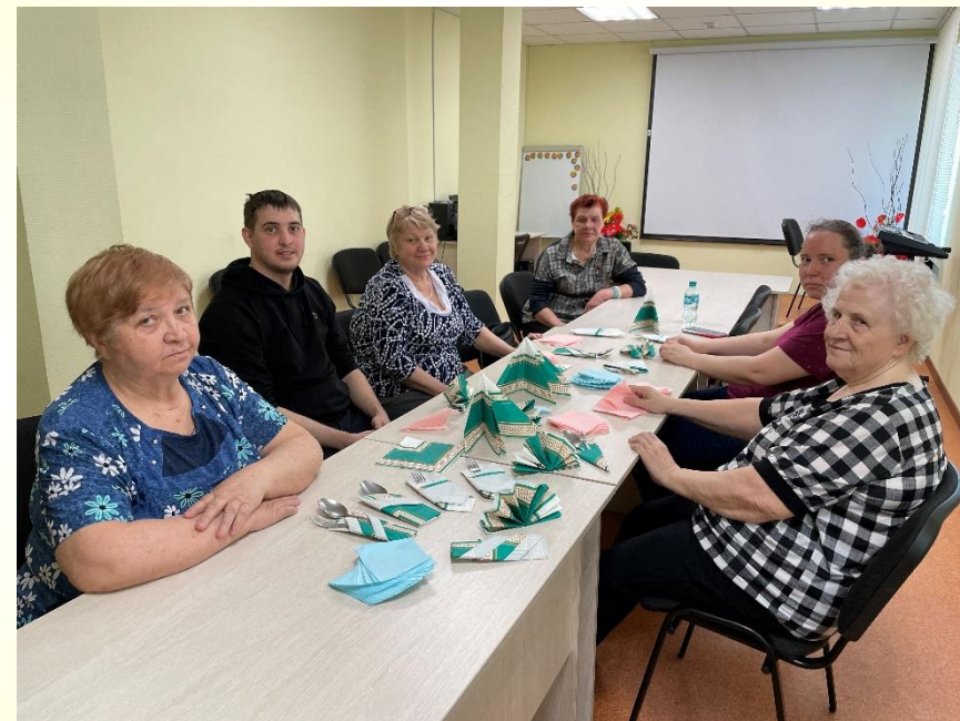
«Фестиваль дарения#МыВместе» - 2022, Центр общественных организаций (ВОС, ВОИ) - мастер-класс по сервировке стола «Добрых рук творение»