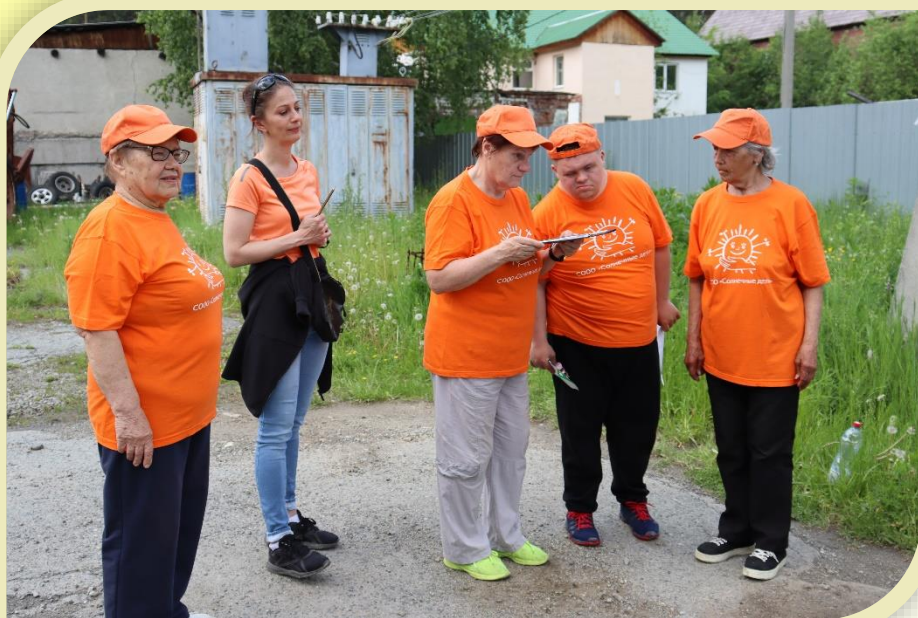
Военно-спортивная игра «Зарница» - 2022, команда ВОС

Государственное автономное учреждение социального обслуживания Свердловской области «Комплексный центр социального обслуживания населения города Березовского»