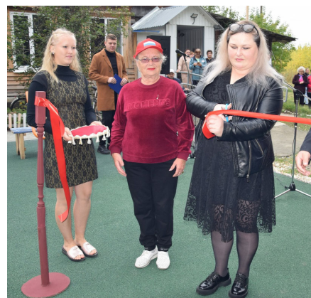
ПАННО В ТЕХНИКЕ «ТЕРРА»

ОТКРЫТИЕ МНОГОФУНКЦИОНАЛЬНОЙ СПОРТИВНО - ОЗДОРОВИТЕЛЬНОЙ ПЛОЩАДКИ