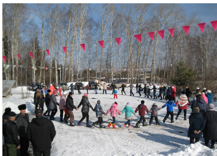
«Хороводы на Масленицу»