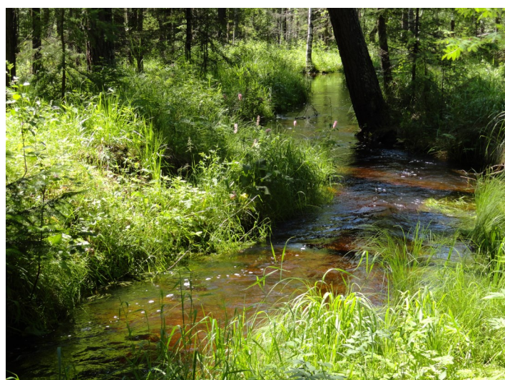
«Лесной ручей»