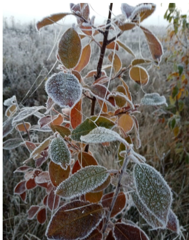
«Изморозь», фото Нефедьевой Г.А.