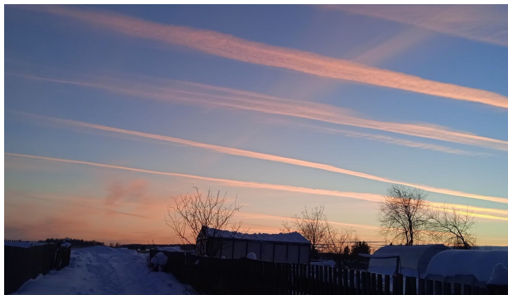
«Во власти стихии», фото Лебедевой Л.Э.