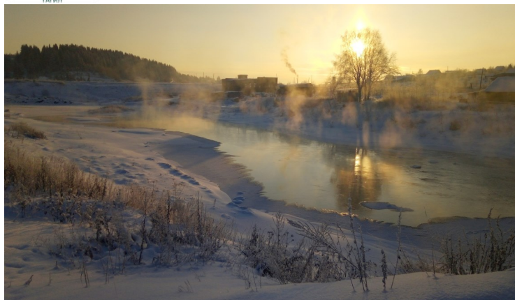
«Во власти стихии»