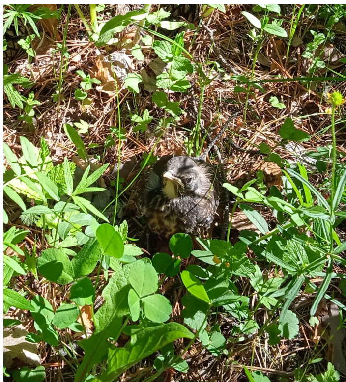
«Птенцы», фото Филиной И.Н.